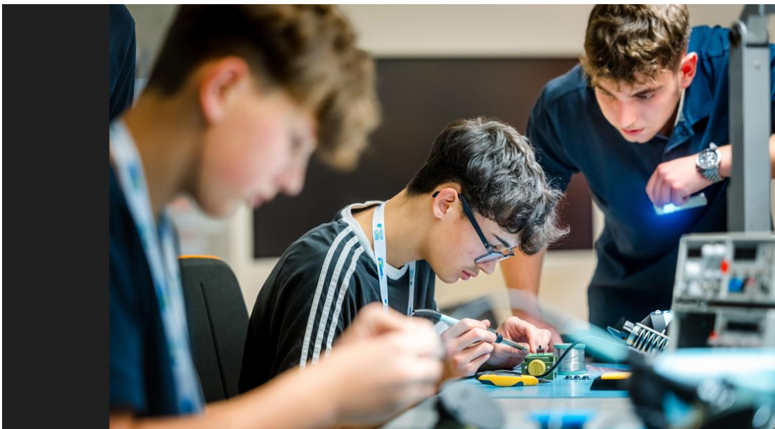
Bildunterschrift: Mitmach-Aktion bei Adtran Networks SE in Meiningen / OT Dreißigacker. Schüler erhielten während der AZUBI TOUR Einblicke in Ausbildungsberufe und die Tätigkeiten während der dualen Ausbildung.