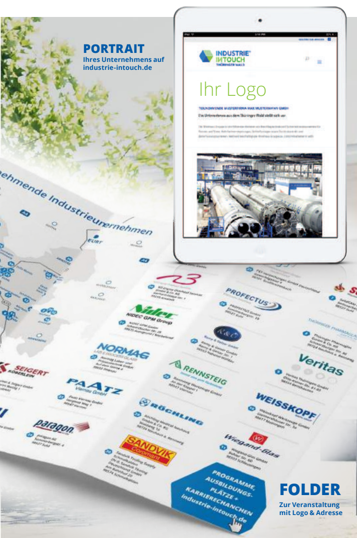
PORTRAIT Ihres Unternehmens auf industrie-intouch.de