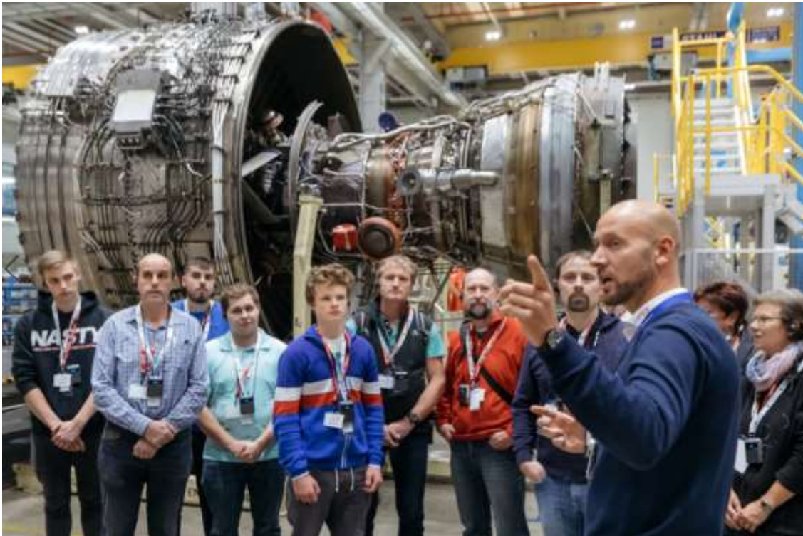
Bildunterschrift 3: High-Tech hautnah erlebten die Besucher der N3 Engine Overhaul Services GmbH & Co. KG. In dem Arnstädter Unternehmen werden Rolls-Royce-Großtriebwerke für Flugzeuge überholt und instandgesetzt.