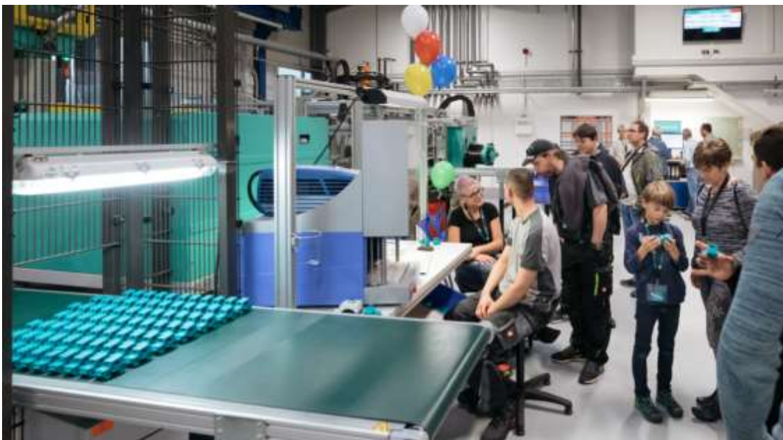
Bildunterschrift 4: Die Hehnke GmbH & Co. KG zeigte ihren Besuchern von INDUSTRIE INTOUCH Thüringer Wald nicht nur die neueste Robotertechnik und Industrie 4.0 live. Jeder Besucher konnte sich auch ein personalisiertes Give-Away mitnehmen.